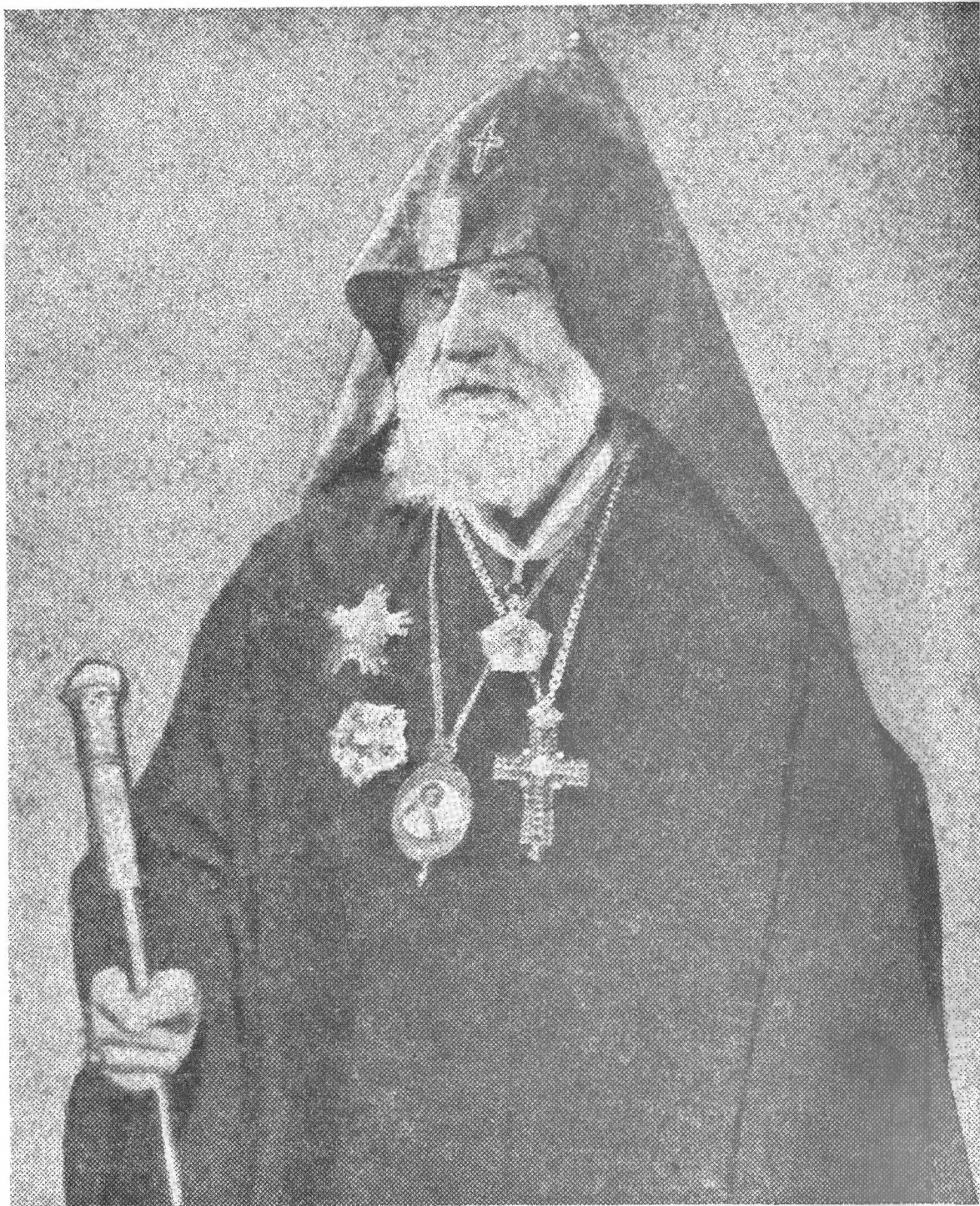
Նորին Սուրբ Օծուրիւն Տ. Տ. Գարեգին Կարողիկոս Յովսէփեանց