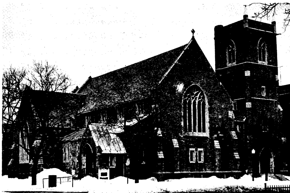
Cathedral Armenienne St. Gregoire L'Illuminateur Montréal