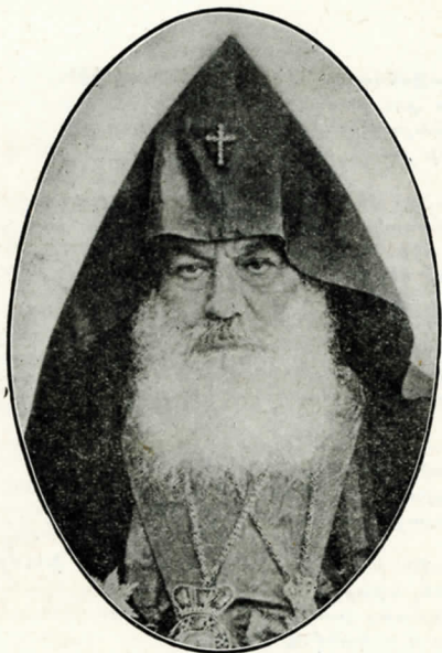
Տ. Տ. ԳԵՈՐԳ Ե.

Մայրազոյն Պատրիարք եւ Կաթողիկոս Ամենայն Հայոց