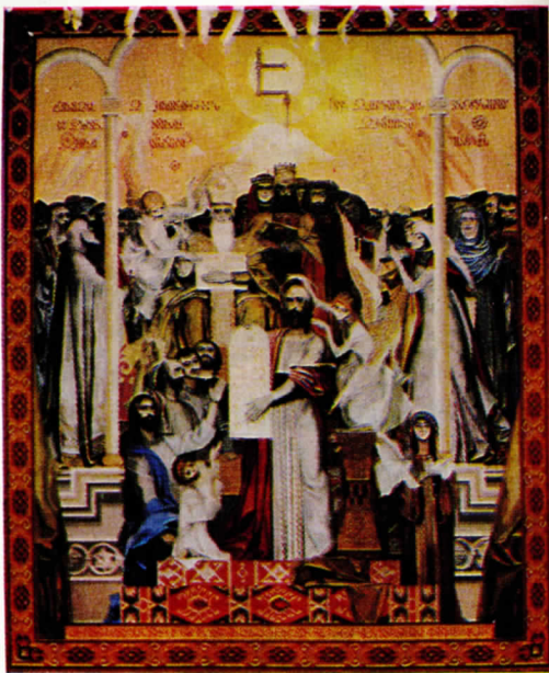
Գորելեն—Ս. Մեսրոպ - Ս. Սահակ, 1980 թ. նկ. Գր. Խանճեան

6/19 † ԲՂ. ԳՁ. ՏՕՆ ԾՆՆԴԵԱՆ ԵՎ ԱՍՏ- ՈՒԱՄԱՅԱՏՏԵՆՈՒԹԵԱՆ ՏԵԱՌՆ ՄԵՐՈՅ ՅԻՍՈՒՄԻ ՔՐԻՍՏՈՍԻ: