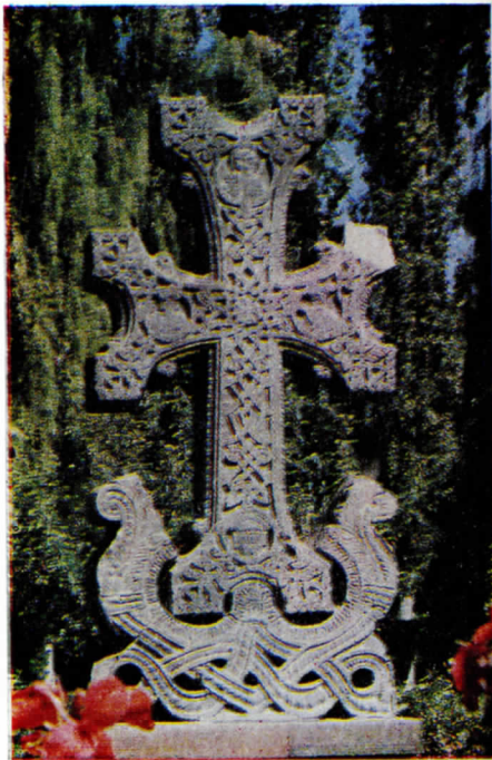
Խաչքար 17-րդ դար

որպէս դանձրն: Քրդ. Մայր Սուրբ: Ս. Աստուած՝ որ յարեար: Հմբ. դձ. Նոր Միովն ծնեալ: Ս. զԱստ., կեցո, Բնկալ Տէր: