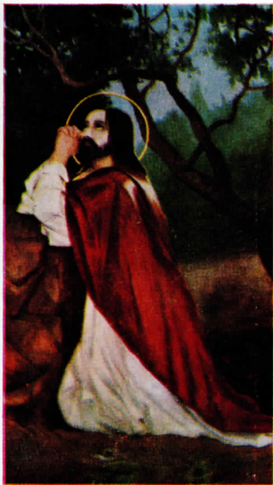
Յիսուս Գեթսեմանի պարտեպում, 1900 թ. նկ. Վ. Սուրէնեանց

21 † Շբ. ԱՁ. Ընծայումն Ս. Աստուածած- 30 նի Երից ամաց ի Տաւարն: Զկնի Ռահ զործեալին երգ՝ Զայնի առ քեզ: Օրհ. գկ. Երգեցէք որդիք, իւր սարօքն: Քրզ. Մայր Սուրբ: Ս. Աստուած՝ որ խաչե- ցար: Տէրն յետ ստեղծման: Ս. զԱստ., Կեցո, Ընկալ Տէր: Ժմտ. Աստուածածին զքեզ խոստովանիմք: Ճշ. շրկ. գկ. Մառ կենաց: Սրբ. Բազմութիւնք: Յերեկոյին՝ Լոյս զուարթ: Մնադ. Իջցէ