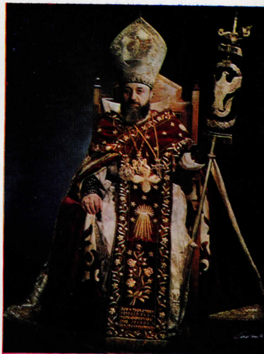
ՆՈՐԻՆ ՍՈՒՐԲ ՕՏՈՒԹԻՒՆ Տ. Տ. ՎԱՉԳԷՆ Ա ԿԱԹՈՂԻԿՈՍ ԱՄԵՆԱՅՆ ՀԱՅՈՑ