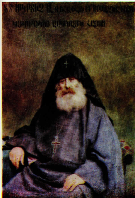
Խրիմեան Հայրիկի նկարը 1900 թ. նկ. Ե. Թադևասեանի