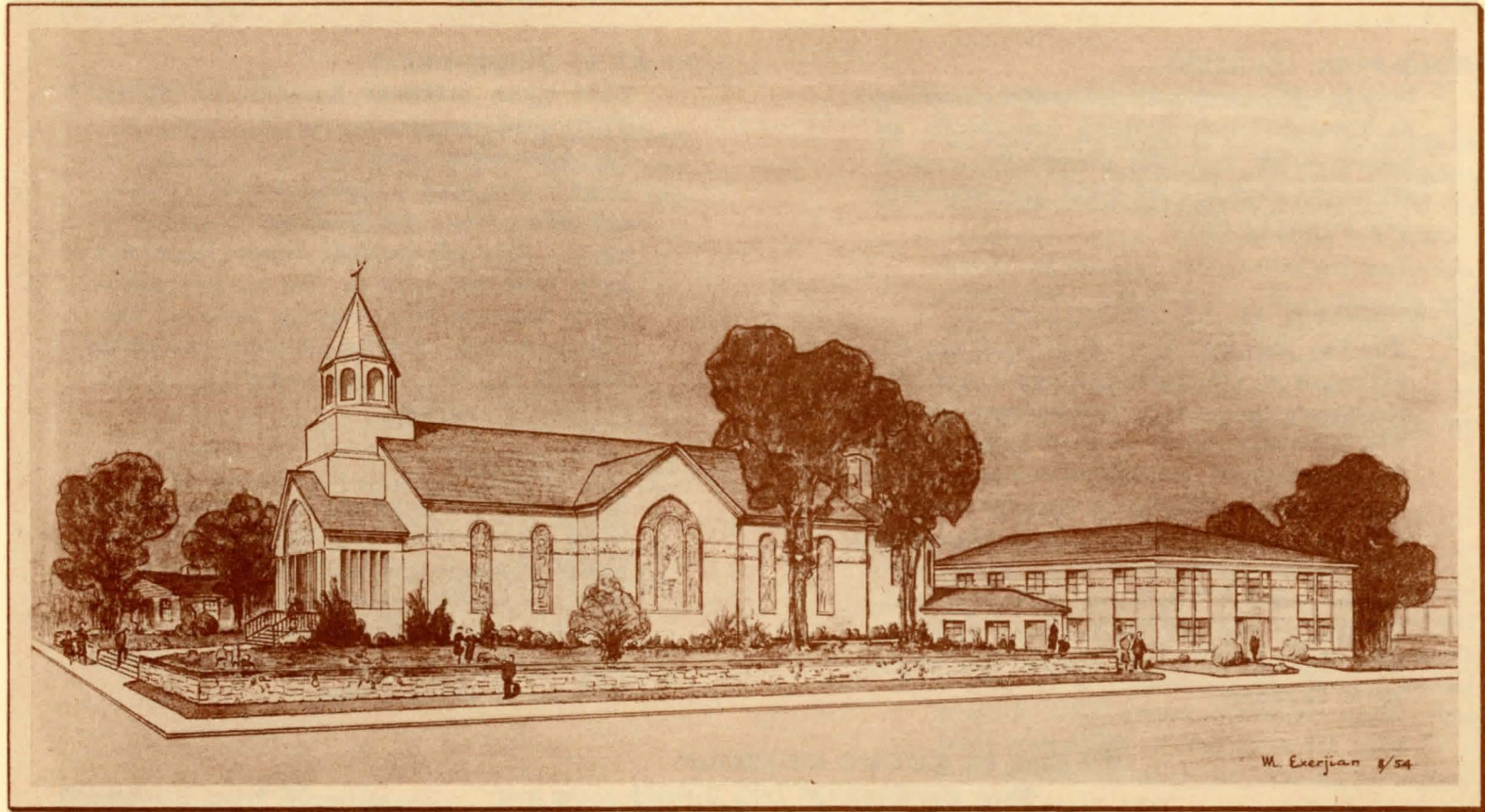
A perspective sketch by Manoung Exerjian A.I.A. of the new Long Island Armenian Apostolic Church on the block front north side of Horace Harding Blvd. Oceana Ave. to 210th St., Queens, New York.