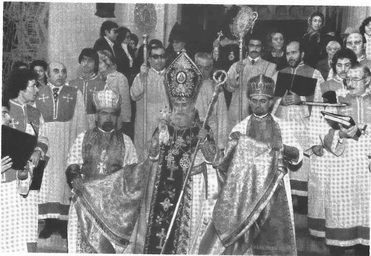
Ամենապատիւ Սրբազան Պատրիարք Հայրը 1974-ին Ս. Վարդան Մայր Տաճարէն ելքի պահուն: