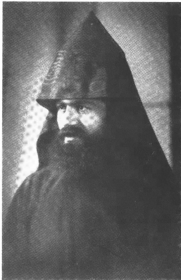
Շնորհք Արղ. Գալուստեան

Ամենապատիւ Ա. Պատրիարք Հօր գա- հակալութիւնը տեղի ունեցած է 1962 Յուն- ուար 3ին փառահեղ հանդիսատրութեամբ: