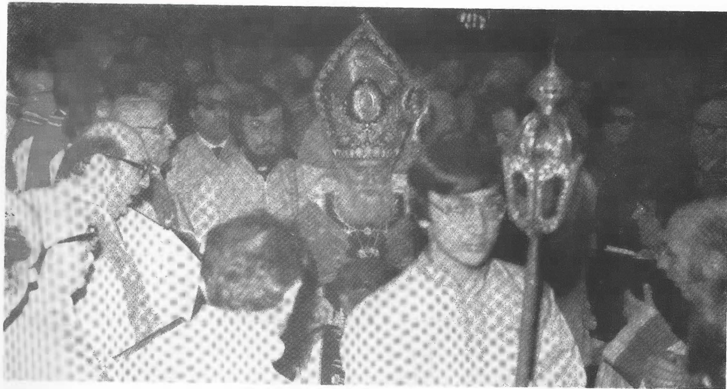
Ամենապատիւ Տ. Ծնորիք Արք. Գալուստեան 1976-ին Նիւ Եորքի Ս. Վարդան Մայր Տաճարին մէջ: