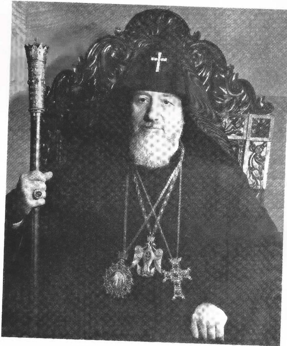
His Holines Vazken I, Catholicos of All Armenians