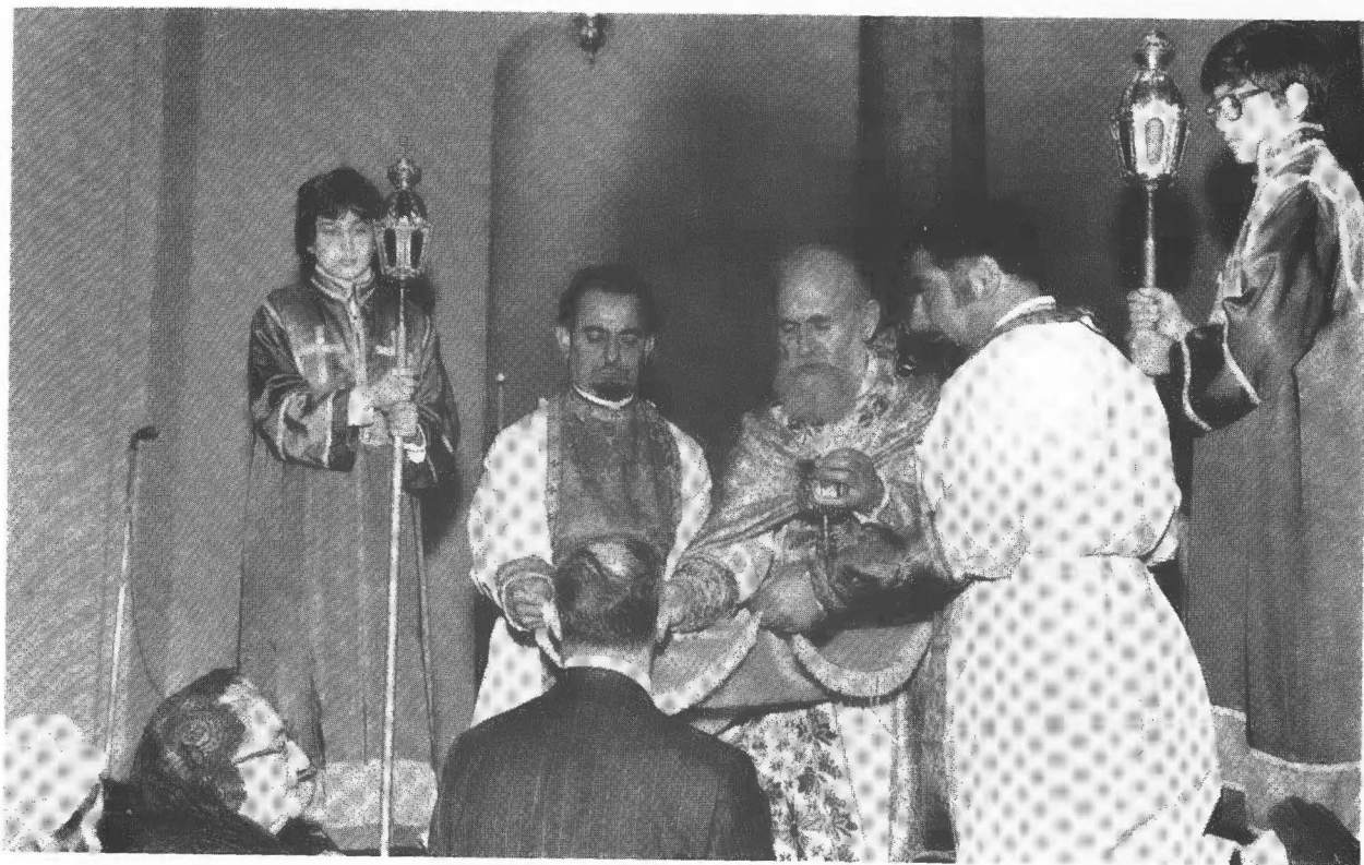
Ամենապատիւ Սրբազան Պատրիարք Հայրը 1974-ին Ս. Վարդան Մայր Տաճարի մէջ Ս. Հաղորդութիւն տուած պահուն: