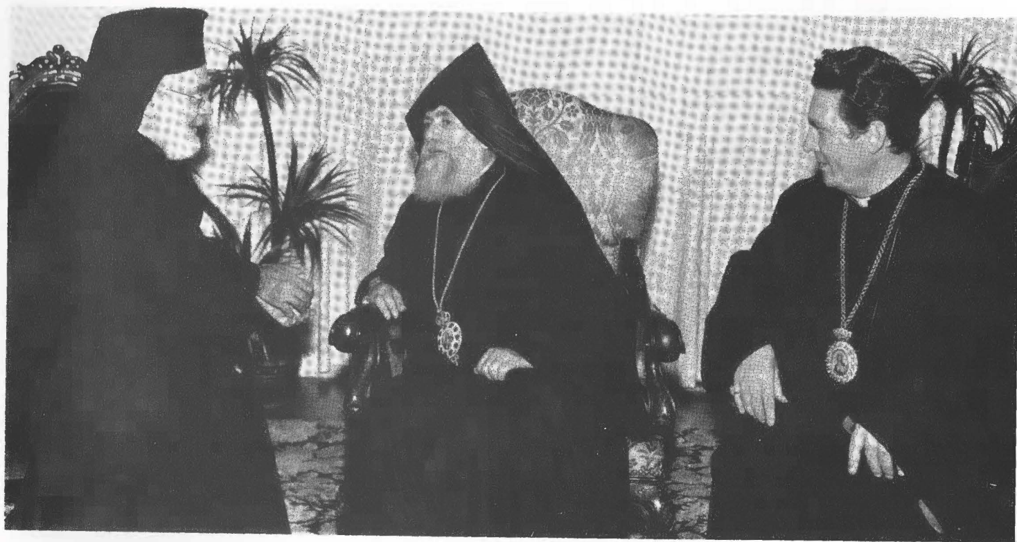
Ամենապատիւ Սրբազան Պատրիարք Հայրը Յոյն Ուղղափառ Եկեղեցոյ Առաջնորդին՝ Եսրովոս Արք.ին եւ Գերշ. Տ. Թորգոմ Արք.ին հետ: