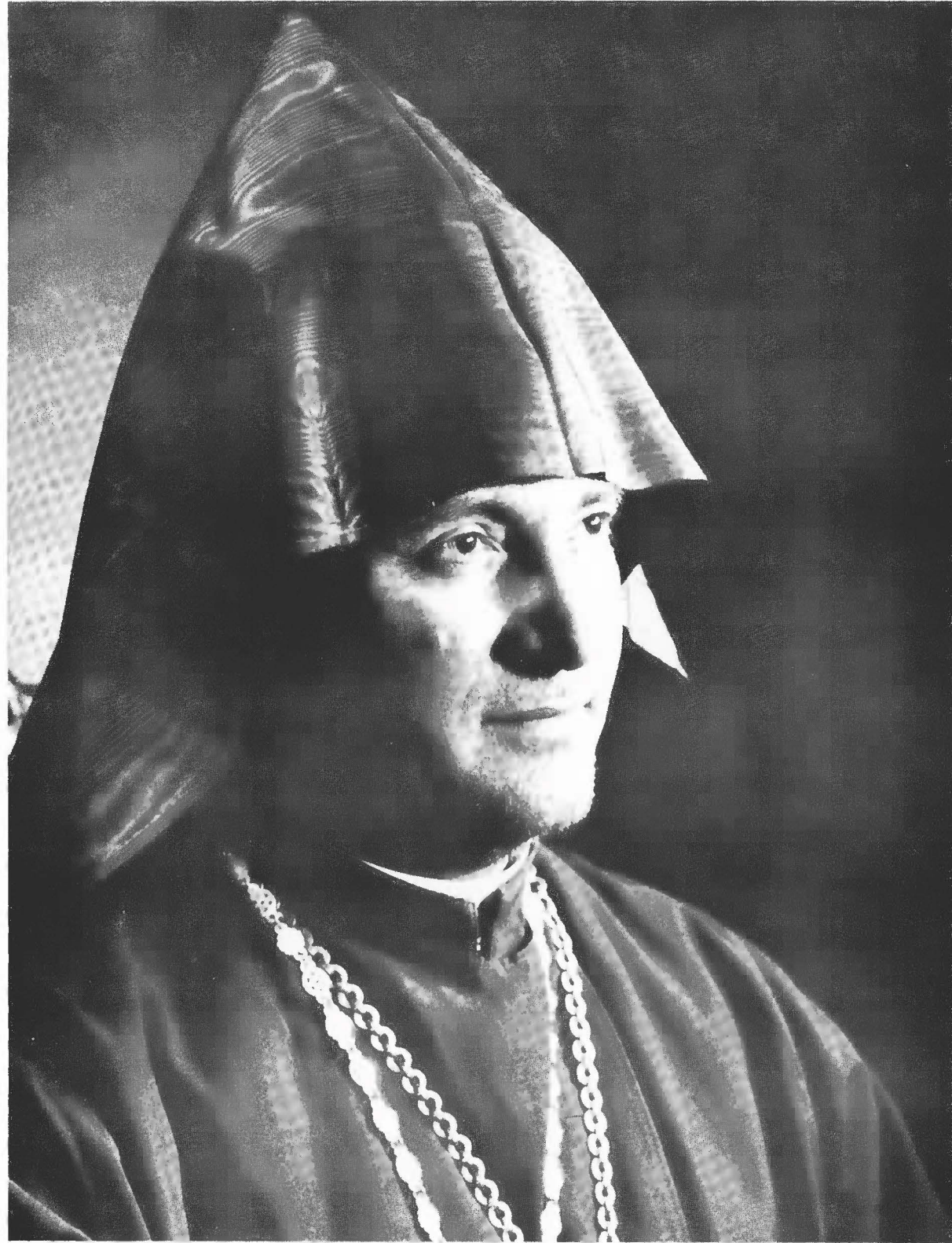
Գերազնորհ Տ. Թորգոմ Արք. Մանուկեան Առաջնորդ Ամերիկայի Հայոց Արեւելեան Թեմի