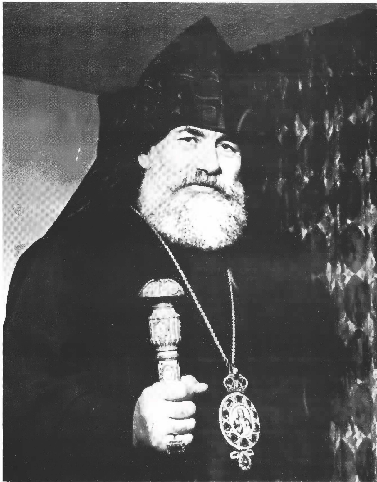
Ամենապատիւ Ս. Ծնորդ Արք. Գալուստեան Պատրիարք Հայոց Թուրքիոյ