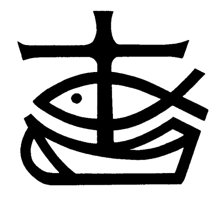
September 12, 1978

Telephones: (Code 201) Church: 791 - 2862 Rectory: 791 - 1583