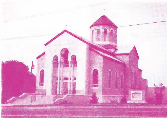
Ա. Երրորդութիւն հԱՅՑ. ԵԿԵՂԵՑԻ Կոթ. Տարեդարձ օծման