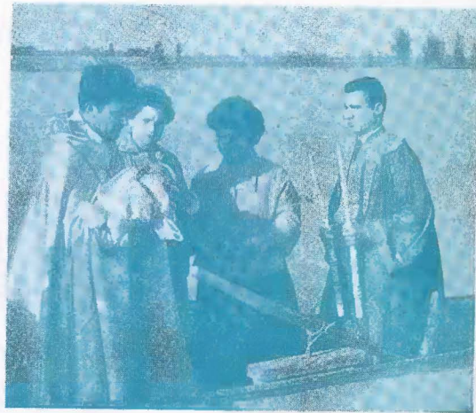
"Արևի որդի՛ վարրի՛" Անտուրիան Յորդանան գծտին մէջ:

Մործայ Եկեղեցականը ապագայի լուսաւոր խոր- հորդներով Լեցուն: