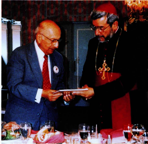
With His Beatitude John Peter XV Kasparian, Catholicos Patriarch of the Armenian Catholic Church.