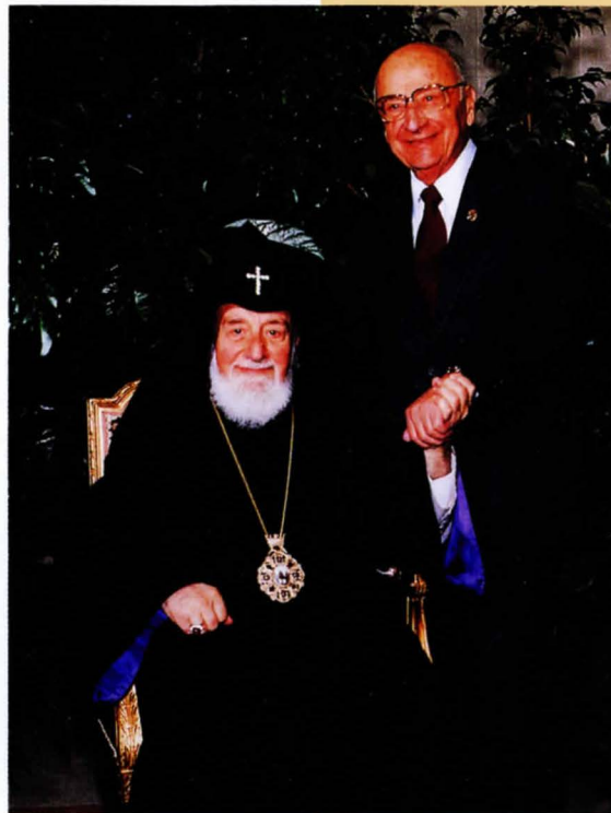
Solidarity with His Holiness Vazken I for the last 40 years.