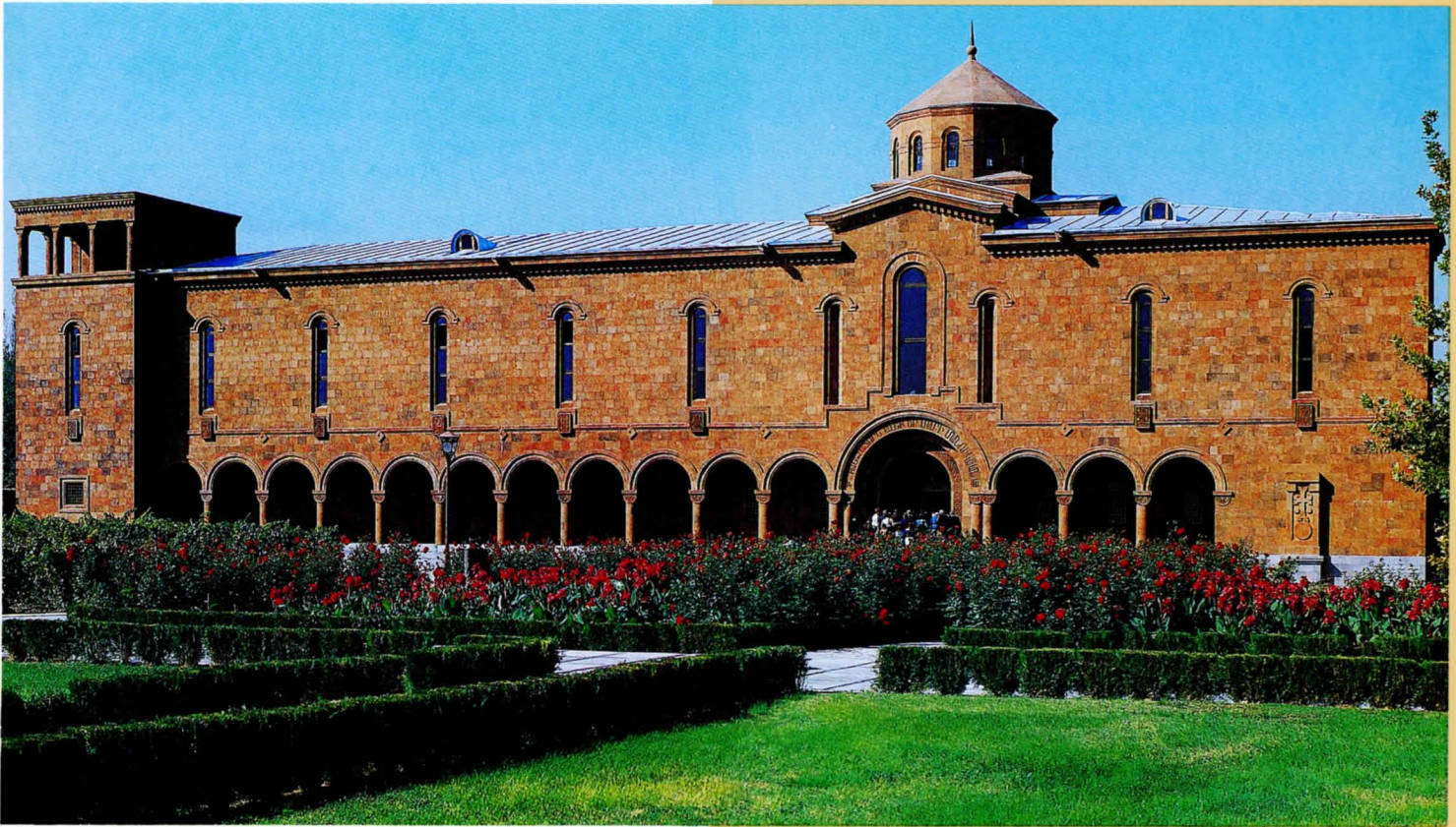
Alex and Marie Manoogian Museum next to the Mother Cathedral of Etchmiadzine in Armenia.