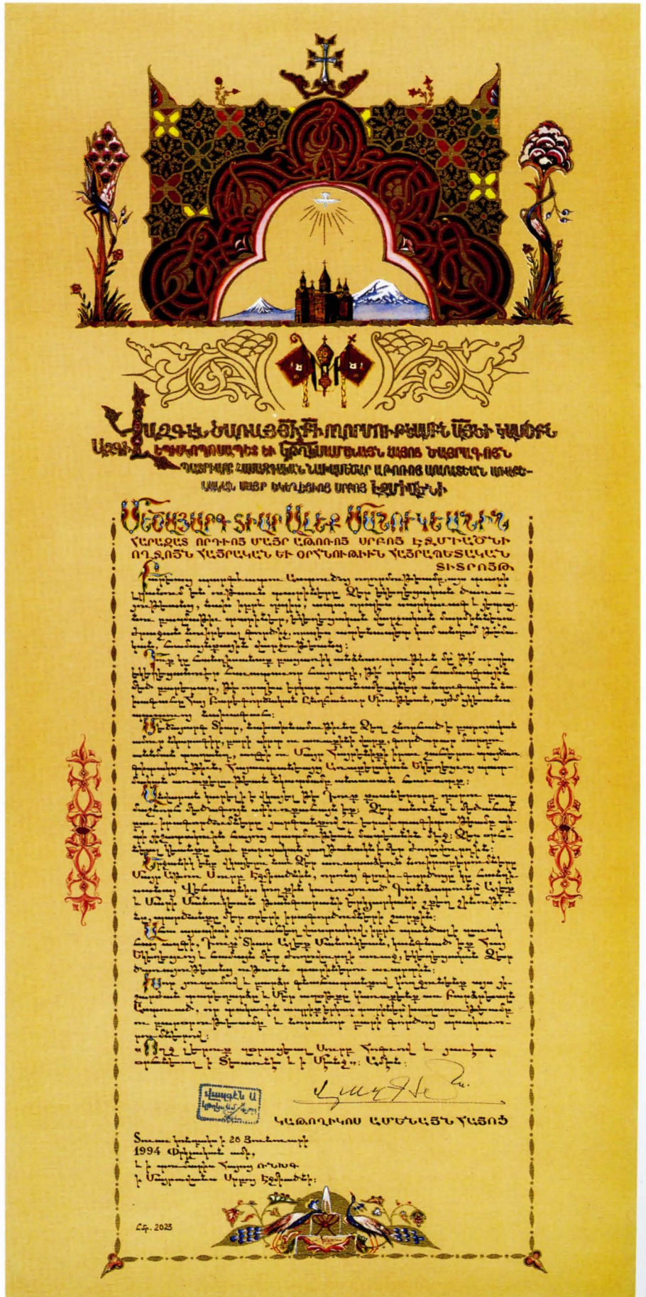
Encyclical by His Holiness Vazken I, Catholicos of all Armenians.