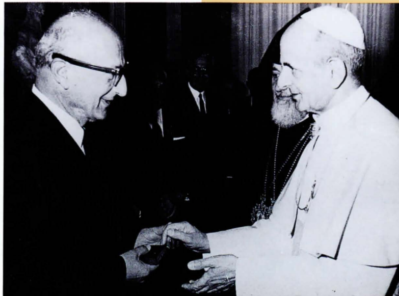
Greeted by Pope John Paul VI at the Vatican.

Ալեք Մանուկեանի մասնակցութիւնը եկեղեցական գործերուն չի սահմանափակուիր միայն Տիրոջ թոյժով այլ հետզհետէ կ'ընդարձակուի ամբողջ թեմին վրայ եւ ապա՝ բովանդակ սփիւռքահայ կեանքին: