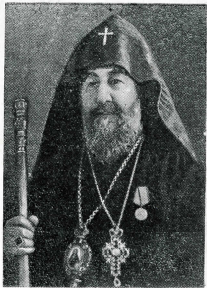
Տ. Տ. ԳԷՈՐԳ Զ. Վեհափառ Կարողիկոս Ամենայն Հայոց

ԺԱՅՐԱԳՈՅՆ ՊԵՏՐԻԱՐԺԻ ՆԻ ՍՐԲԱԶՆԱԳՈՅՆ ԿԵԹՈՂԻԿՈՍԻ ԱՄԵՆԱՅՆ ՀԱՅՈՑ