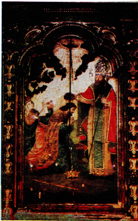
Տրդատ III թագաւորի մկրտութիւնը: Սուշասա XVIII դար: