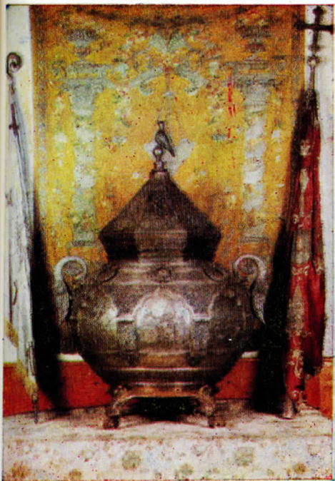
Սրբալոյս Մեռոնի կաթսան 1895 թ.: