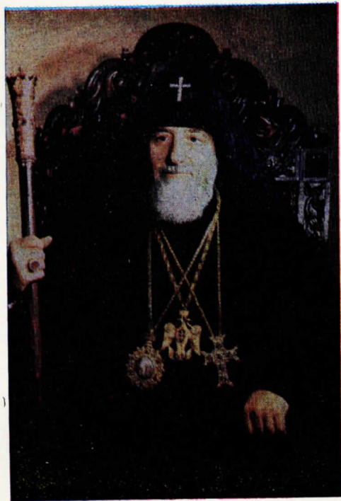
ՆՈՐԻՆ ՍՈՒՐԲ ՕԾՈՒԹԻՒՆ Տ. Տ. ՎԱԶԳԷՆ Ա. ԿԱԹՈՂԻԿՈՍ ԱՄԵՆԱՅՆ ՀԱՅՈՑ