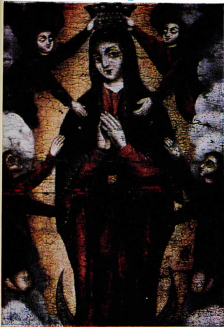
Ս. Աստուածածին: Սրբանկար 17-րդ դար: