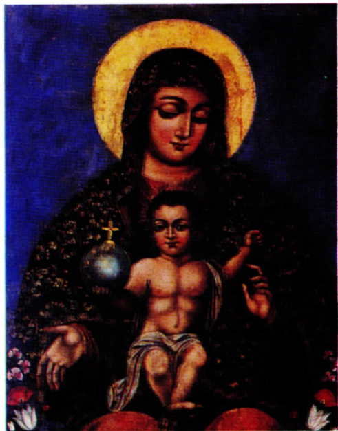
Աստուածամայրը մանկան հետ. Ակ. Յովնաթան Յովնաթանեանի