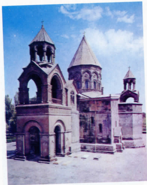
Մայր Տաճար Ս. Էջմիածին (808 թ.)

ՎԵՀԱՓԱՌ ԵՒ ՍՐԲԱՋՆԱԳՈՅՆ ԿԱԹՈՂԻԿՈՍԻ ԱՄԵՆԱՅՆ ՀԱՅՈՑ