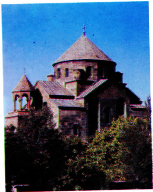
Ս. Հոփփսիմէի տաճարը, 618 թ.