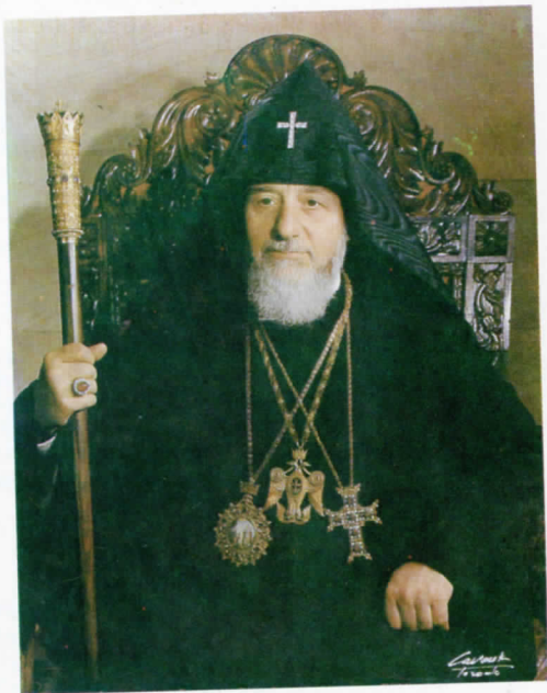
ՆՈՐԻՆ ՍՈՒՐԱ ՕՇՈՒԹԻՆ Տ. Տ. ՎԱԶԳԷՆ Ա ԿԱԹՈՂԻԿՈՍ ԱՄԵՆԱՅՆ ՀԱՅՈՑ